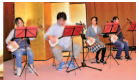
邦楽三味線倶楽部の演奏