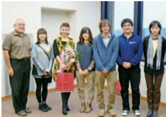
ドイツ文化研究会の学生と

講演会の終わりには、本学の学生団体であるドイツ文化研究会(顧問・経済学部 明石真和教授)の学生から、ドイツ平和村への募金活動の呼びかけがあり、ドイツ文化研究会とこの日参加し