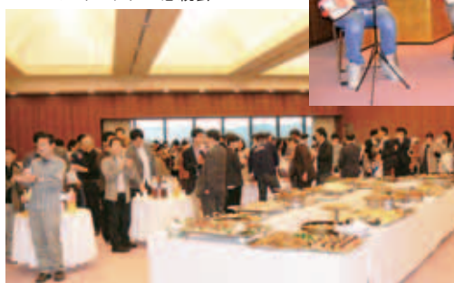
平成23年度(第10回) ホームカミングデー懇親会